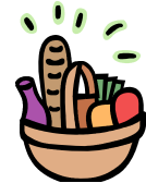
3. canasta de bendición