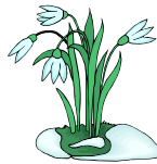
5. campanillas de invierno