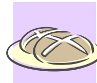
6. bolos cruzados