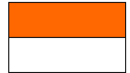
Bandera de Indonesia (roja y blanca)

Bali es una isla pequeña, menos de 150 km de largo, ubicada en Indonesia en el Sudeste de Asia.